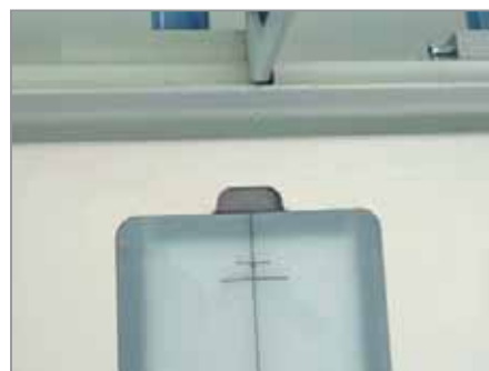
Регистрационные метки для позиционирования картонных сторон разной толщины