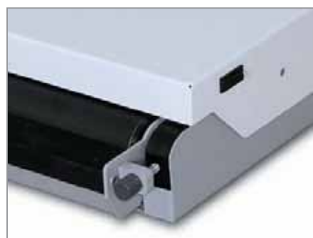
Встроенный пресс для обжима клапанов имеет возможность настройки на обжим картона для сторон разной толщины