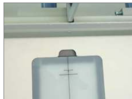
Регистрационные метки для позиционирования картонных сторонки разной толщины