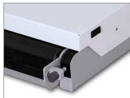
Встроенный пресс для обжима клапанов имеет возможность настройки на обжим картона для сторонки разной толщины