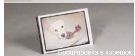
Брошюровка в корешок