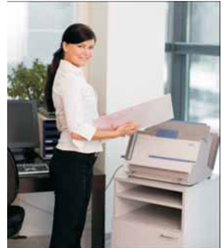
Брошюровка книг, фотокниг за несколько секунд