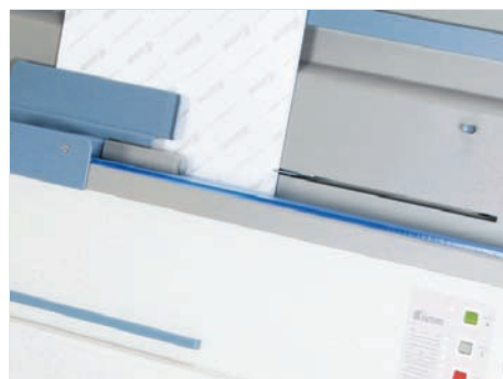
Автоопределение формата брошюры и установка скоб по заданной программе