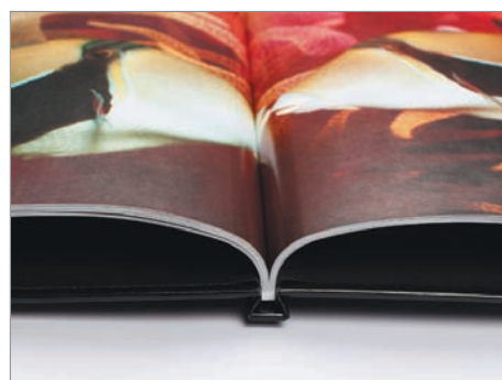
Аккуратный прямоугольный корешок

Поддержка многих финишных операций: - книги в переплетной крышке - брошюры в мягкой обложке - брошюры в клеевом корешке